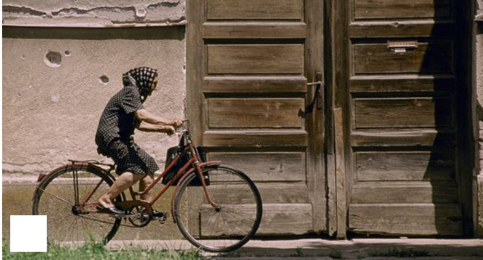
Una mujer conduciendo una bicicleta.

Zonas verdes: unanimidad. Buen transporte público: unanimidad. Reciclaje, buen uso de la energía, zonas caminables: unanimidad. Los arquitectos coinciden en muchas de las necesidades de las ciudades del futuro. Aunque cada uno da prioridad a unas u otras facetas del desarrollo. Ocho de los grandes arquitectos de la actualidad ofrecen su visión sobre cómo sería su metrópoli ideal en 2050.